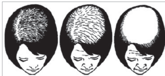
FIGURA 2. CLASIFICACIÓN DE LUDWIG

Fuente: Blume- Peytavi U, Blumeyer A, Tosti A, et al. S1 Guideline for diagnostic evaluation in androgenetic alopecia in men, women and adolescents. Br J Dermatol 2011; 164(1):5- 15.