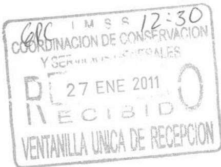
FIGURA DE CORRESPONDENCIA RESPACHADO

SECRETARÍA DE GOBERNACIÓN ARCHIVO GENERAL DE LA NACIÓN UNIDAD ADMINISTRATIVA DE SERVICIOS ENC 6 9 43 AM 2011 DSNA/AJAG/mlgn.