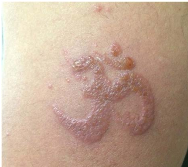
Figura 2. Eczema subagudo. Dermatitis de contacto irritativa.