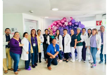
UMF No. 39, Villahermosa.