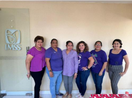
UMF No. 43, Villahermosa.