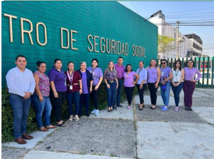
Centro de Seguridad Social, Villahermosa.