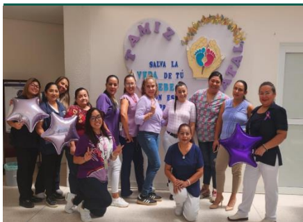
UMF No. 47, Villahermosa.