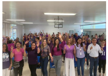
Alumnado del Centro de Seguridad Social.