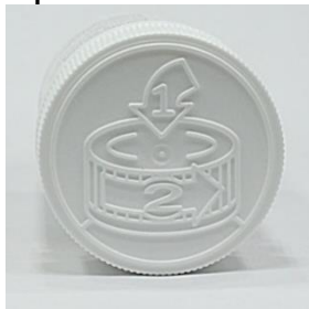
Producto Original Tapa ilustrativa sin texto