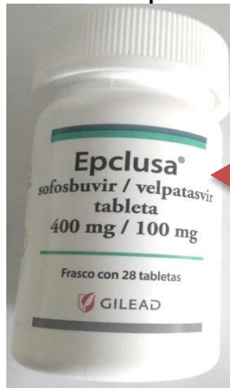
Producto Original Texto en Español